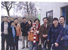
上图：驻塞内加尔总领馆教育组看望遇车祸受伤的留学生。