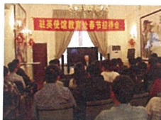
左图：2012年驻英国使馆教育处举办新春招待会。

回调研报告1200余篇，编印国外教育调研材料汇编16期，其中15篇调研报告得到国家领导人重要批示。